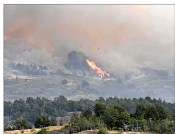
DAÑOS.—En esta temporada, la región con más daño en su bosque nativo fue Aysén. El fuego quemó 5 mil hectáreas de especies silvestres.