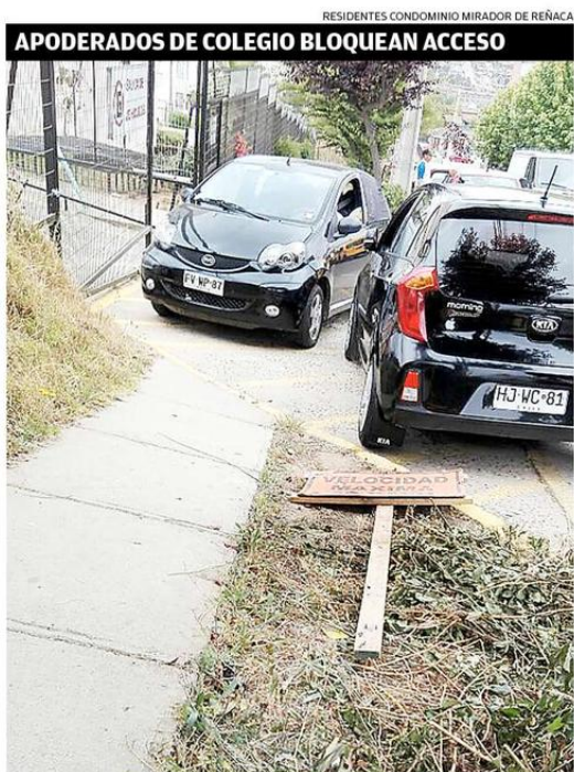
RESIDENTES CONDOMINIO MIRADOR DE REÑACA